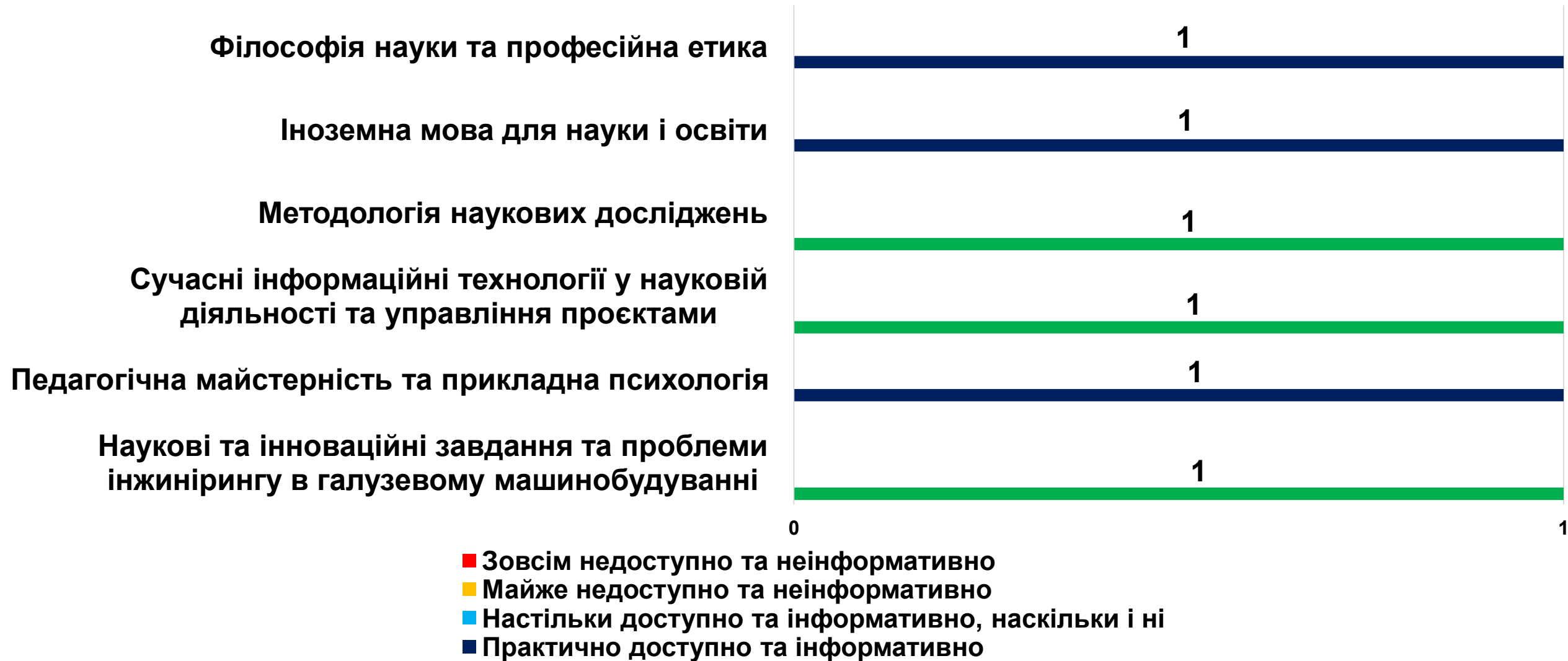
Рисунок 2 – рівень доступності та насиченості інформаційно-методичного забезпечення дисциплін освітньої програми